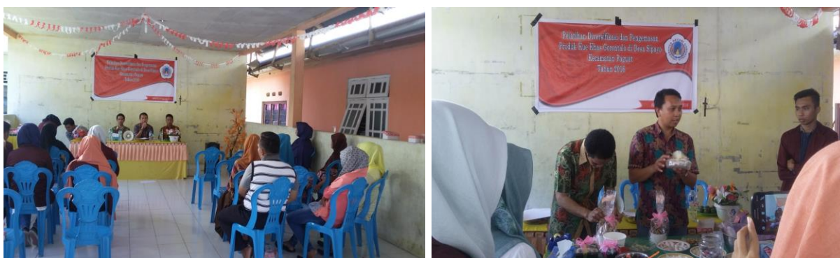
Gambar 2. Pelaksanaan Pengabdian Diversifikasi Produk

Selain dengan diversifikasi produk, dilakukan juga teknik pengemasan produk. Selama ini pengemasan produk baik untuk kue bilibidu dan permen soba hanya biasa saja dan kadang tidak menarik, seperti untuk kemasan permen soba yang dibungkus dengan kertas minyak saja atau bahkan dengan menggunakan kertas Koran atau kertas bekas. Padahal pengemasan produk sangat penting dalam memikat daya tarik konsumen untuk membeli produk tersebut, sehingga dengan demikian diberikan metode pengemasan yang baik dan menarik untuk kue bilibidu dan permen soba agar konsumen tertarik untuk membeli produk tersebut.