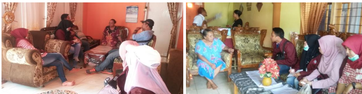
Gambar 1. Pendataan dan Sosialisasi Pelaksanaan Pengabdian

konsumen. Pada tahapan ini dilakukan demo mendiversifikasi produk kue bilibidu dan permen soba dengan salah satu cara adalah membuat kue bilibidu dan permen soba dengan berbagai aneka rasa seperti rasa coklat, strawberi, coklat kacang, duren, dan lain-lain. Hal ini dimaksudkan agar produk kue bilibidu dan permen soba mempunyai cita rasa yang berbeda dengan produk yang serupa di daerah lain.