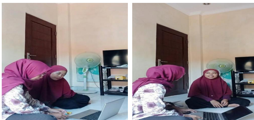
Gambar 2: Penyampaian Materi

pencatatan keuangan serta penyusunan pembukuan sederhana yang mudah dipahami dan diterapkan oleh pelaku usaha. Penyampaian materi dilakukan secara langsung dengan metode penjelasan yang sistematis dan disesuaikan dengan kondisi serta kebutuhan mitra. Selain penyampaian materi, kegiatan ini juga dilengkapi dengan sesi tanya jawab dan diskusi interaktif antara tim pelaksana dan pelaku UMKM. Dalam sesi ini, pelaku usaha diberikan kesempatan untuk menyampaikan berbagai kendala yang dihadapi dalam pencatatan keuangan serta berdiskusi mengenai solusi yang dapat diterapkan. Diskusi berlangsung secara aktif sehingga membantu meningkatkan pemahaman mitra terhadap materi yang telah diberikan.