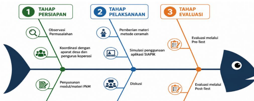
Gambar 1. Tahapan PkM

Kegiatan PkM dilakukan berdasarkan permasalahan yang ditemukan dilapangan yang difokuskan kepada para pengurus koperasi merah putih desa Bulonthalangi Kec. Bulango Timur. Kegiatan ini dilaksanakan pada hari Kamis 28 Agustus 2025 yang bertempat di aula kantor Desa yang dihadiri oleh unsur aparat desa dan pengurus koperasi merah putih. Terdapat beberapa tahapan dari kegiatan PkM ini yaitu sebagai berikut.