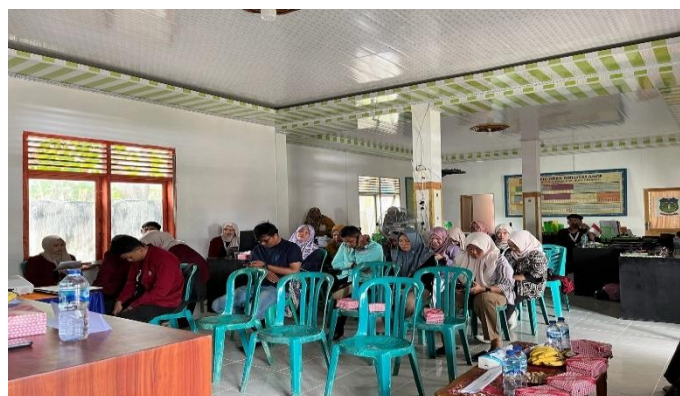
Gambar 4. Peserta Pengabdian kepada Masyarakat

Setelah selesai sesi penyampaian materi dan simulasi, kegiatan ini dilanjutkan dengan sesi diskusi yang berlangsung secara aktif dengan adanya berbagai pertanyaan dari peserta terkait kendala pencatatan keuangan yang selama ini dihadapi serta pertanyaan seputar penggunaan aplikasi SIAPIK. Diskusi tersebut membantu peserta memahami solusi praktis dalam pengelolaan administrasi dan laporan keuangan koperasi berbasis digital.