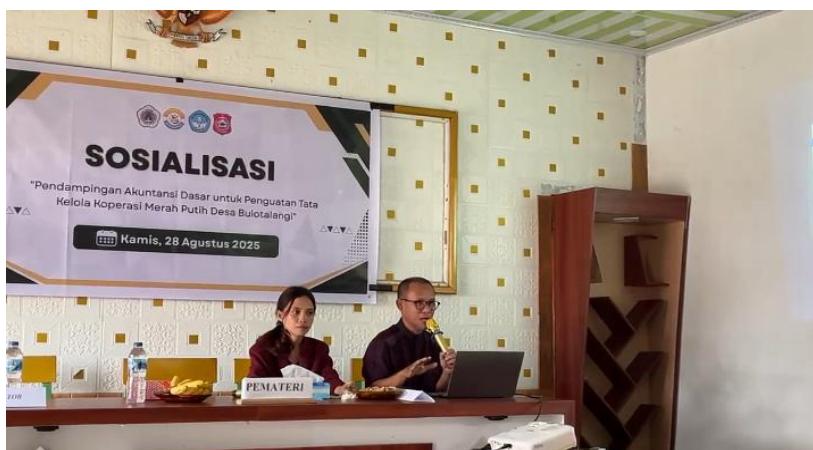
Gambar 2. Sesi Pemaparan Materi

Pelaksanaan kegiatan PkM dihadiri pengurus koperasi merah putih dengan latar belakang pendidikan yang beragam. Kegiatan ini diawali oleh pembukaan secara resmi dari aparat pemerintah desa Bulonthalangi. Tahap pelaksanaan dilakukan melalui metode ceramah, simulasi, dan diskusi interaktif. Pada sesi pemberian materi, peserta diberikan pemahaman mengenai pentingnya pengelolaan keuangan yang akuntabel dan transparan dalam mendukung keberlanjutan koperasi. Peserta juga memperoleh penjelasan konsep akuntansi sederhana mulai dari pencatatan transaksi hingga penyusunan laporan keuangan.