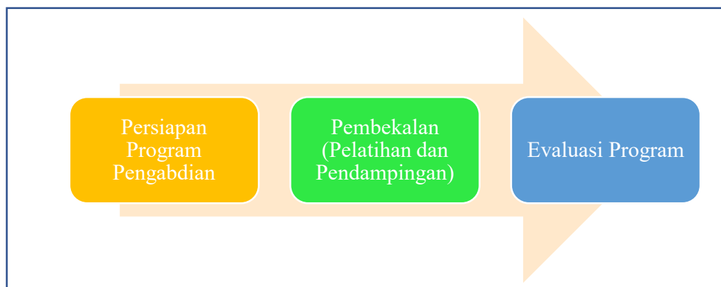
Gambar 1. Tahapan Pelaksanaan Program Pengabdian

Sebagaimana telah diungkapkan sebelumnya bahwa tujuan program pengabdian ini adalah melakukan edukasi penguatan akuntansi manajemen berbasis kearifan lokal untuk keberlanjutan usaha. Adapun fokus metode dari pelaksanaan program ini diarahkan secara spesifik pada internalisasi praktik akuntansi manajemen, yaitu tim pengabdian tidak hanya memberikan pelatihan, tetapi juga mendampingi pengurus dalam menerapkan analisis biaya, perhitungan harga pokok, dan penilaian kelayakan produk secara langsung pada usaha yang dijalankan. Adapun metode program pengabdian yang dilakukan dapat dilihat melalui gambar 1, berikut ini: