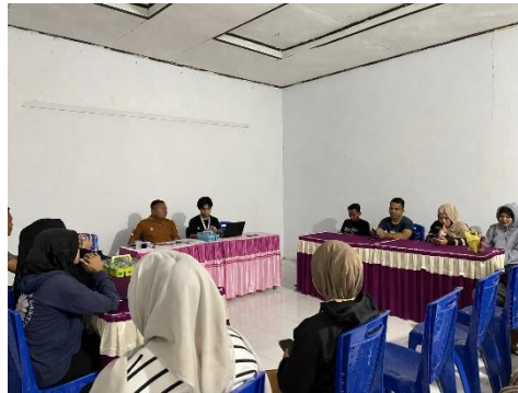
Gambar 2. Pelaksanaan pendampingan

apakah produk yang dikembangkan layak secara ekonomi dan berpotensi menopang keberlanjutan usaha BUMDes Gemilang.