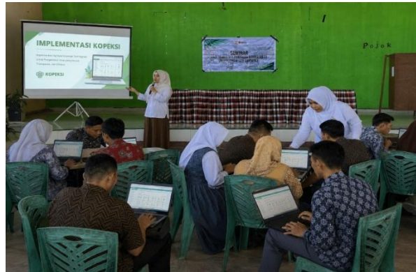
Gambar 4. Pendampingan Implementasi Aplikasi KOPEKSI

menunjukkan bahwa aplikasi ini dapat membantu peserta dalam menyusun laporan keuangan utama secara lebih runtut, terdokumentasi, dan mudah ditelusuri.