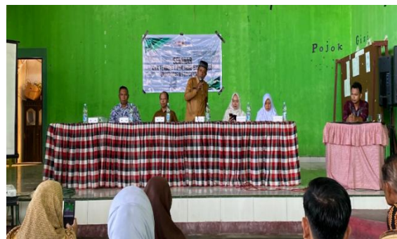
Gambar 1. Identifikasi Masalah & Sosialisasi

Tahap ini juga menjadi ruang awal untuk memperkenalkan perubahan sistem pelaporan dari pola manual menuju pola yang lebih berbasis teknologi. Dengan adanya sosialisasi, peserta memperoleh gambaran umum mengenai tahapan kegiatan, manfaat penggunaan aplikasi, serta hasil yang diharapkan dari pelatihan dan pendampingan.