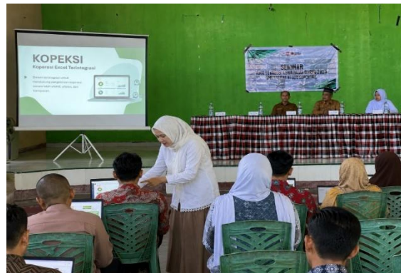
Gambar 3. Praktik Pencatatan

Pada sesi praktik pencatatan, peserta mulai mempraktikkan pencatatan transaksi harian ke dalam jurnal umum dan buku besar dengan menggunakan data riil koperasi. Kegiatan praktik ini memperlihatkan adanya peningkatan keterlibatan peserta dalam memahami alur pencatatan keuangan yang lebih tertib. Selanjutnya, pada sesi penyusunan laporan keuangan, peserta diarahkan untuk menyusun laporan posisi keuangan, laporan aktivitas, dan laporan arus kas dengan menggunakan Aplikasi KOPEKSI. Tahap ini menghasilkan pengalaman belajar yang lebih aplikatif karena peserta tidak hanya menerima materi, tetapi juga langsung mempraktikkan penggunaannya pada konteks koperasi yang mereka kelola.