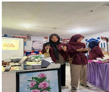
Gambar 4: Pengenalan Alat

Tahap berikutnya adalah pengenalan alat dan bahan yang digunakan dalam proses pembuatan garam infused. Tim pengabdian memperkenalkan berbagai bahan seperti garam, daun jeruk, kulit jeruk, ketumbar, dan lada serta menjelaskan fungsi masing-masing bahan dalam menghasilkan aroma dan cita rasa produk. Selain itu, peserta juga diperkenalkan dengan alat-alat yang digunakan selama proses produksi. Hasil kegiatan menunjukkan bahwa peserta mampu mengenali fungsi bahan dan alat yang digunakan dalam pembuatan garam infused.