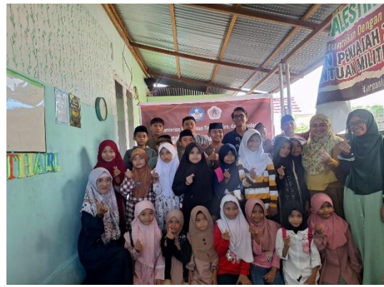
Gambar 3. Simulasi praktek sederhana

Pada bagian akhir kegiatan pelatihan dilakukan kegiatan evaluasi pemahaman peserta dengan melakukan test tertulis untuk semua peserta pelatihan. Hasil pencapaian berdasarkan evaluasi akhir ditampilkan pada tabel berikut: