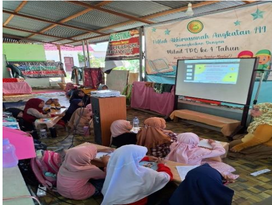
Gambar 2. Penjelasan materi literasi keuangan