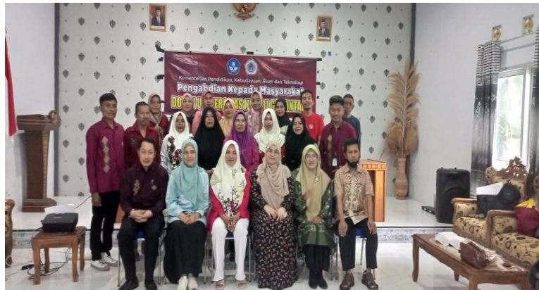
Gambar 4. Sesi Foto Bersama Tim Pengabdian dan Peserta

Sehingganya melalui sesi ini untuk bisa memperdalam lagi pemahaman bagi peserta, yang dimana melalui pengabdian para petani jagung sudah memahami terkait perilaku biaya serta sudah mampu mengidentifikasi atau mengelompokkan setiap biaya yang dikeluarkan atas kegiatan bertani. Dengan informasi yang tepat, petani dapat membuat keputusan yang lebih baik dalam pengelolaan sumber daya, yang pada akhirnya meningkatkan produktivitas dan keberlanjutan usaha tani jagung mereka.