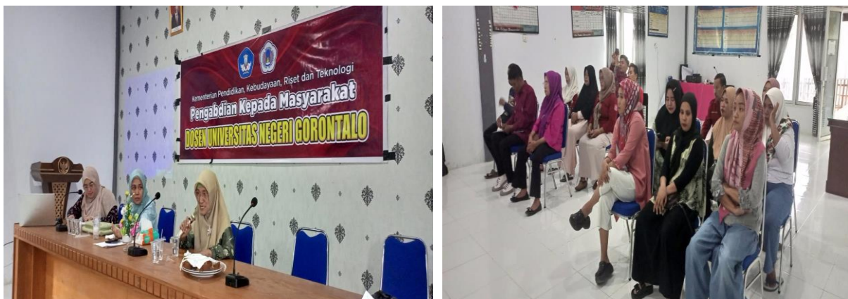
Gambar 3. Sesi Edukasi Kepada Para Peserta Pengabdian

Setelah sesi pemberian materi selesai, dilanjutkan dengan sesi diskusi dua arah atau tanya jawab antar peserta dan tim pengabdian perihal materi yang telah dibawakan tentang edukasi perilaku biaya dan identifikasi biaya tetap dan biaya variabel bagi petani jagung.