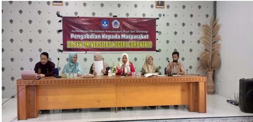
Gambar 2. Pembukaan Kegiatan Pengabdian Masyarakat

Setelah proses pembukaan selesai, maka dilanjutkan pada sesi utama yaitu pemberian edukasi tentang perilaku biaya kepada para peserta melalui metode ceramah. Dari masalah yang ada maka solusi dilakukan adalah memberikan edukasi melalui kegiatan pengabdian yaitu edukasi perilaku biaya kepada para petani dan mengidentifikasi biaya tetap dan biaya variabel. Beban biaya yang harus dikeluarkan oleh petani harus diperhitungkan untuk memenuhi kebutuhan produksi dan juga berpengaruh terhadap pendapatan petani sendiri. Dalam pembagian biaya terdapat biaya tetap dan biaya variabel, edukasi yang disampaikan kepada para peserta yaitu pengelompokan biaya sehingga para petani mengetahui dan paham penting pengelompokan biaya. Berikut ini tabel identifikasi biaya.